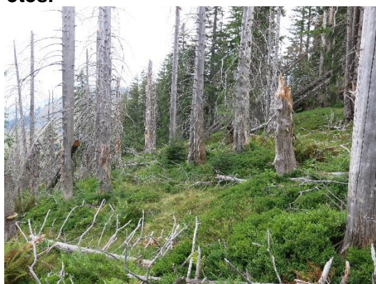
Legende: Im Waldreservat Amden wird Totholz zugelassen. Der seltene Dreizehenspecht und viele weitere Arten profitieren davon.